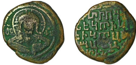
Նկ. 10. Տաշիր-Չորագետի հայկական թագավորություն, Կյուրիկե Բ, 1048-1089 թթ., պղնձե դրամ

Բագրատունյաց թագավորության ժամանակաշրջանում (885-1045 թթ.) դրամներ չեն հասվել, սակայն Տաշիր-Չորագետի փոքրիկ թագավորությու-