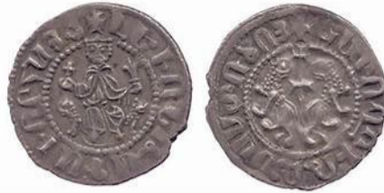
Նկ. 11. Կիլիկիայի հայոց թագավորություն, Լևոն Ա, 1198-1219 թթ., արծաթե դրամ

հայերեն գրություններ: Թագավորության շրջանում (1198-1375 թթ.), արքա