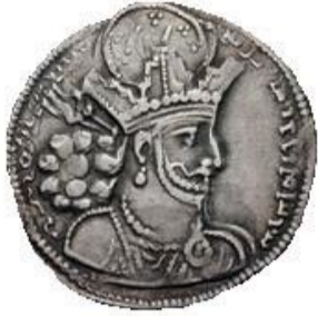
Սկիզբը նախորդ համարում

III դարի կեսերից Հայաստանում սկսում են շրջանառվել Սասանյան Իրանի, իսկ V դարի վերջից՝ նաև Բյուզանդական կայսրության դրամները: Շապուհ 1-ի շրջանի մետաղադրամ: