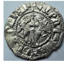
Գրված է Լևոն թագավոր ամենյան Հայոց: Կարողութեմա Աստծոյ:

XIII դարի սկզբից Հայաստանի հյուսիսում և արևելքում շրջանառվել են