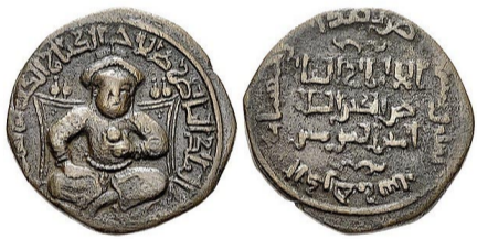
Սալահ ադ Դիմը՝ պատկերված դիրհեմ մետաղադրամի վրա, մոտ 1190 թվական:

X դարի վերջից արաբական արծաթե դիրհեմներին փոխարինում են բյուզանդական ոսկե դրամները և պղնձե ֆոլիսները, որոնք տարածաշրջանում կատարում էին հիմնական դրամական