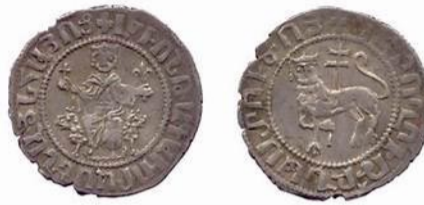
Կիլիկիայի հայոց թագավորություն, Լևոն Ա, արծաթե դրամ

Լևոն Ա-ից (1198-1219 թթ.) սկսած, առատորեն թողարկվել են արծաթե և պղնձե, երբեմն՝ բիլոնե (արծաթի ցածր պարունակությամբ համաձուլվածք) դրամներ: