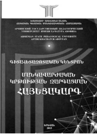
ԳԻՏԱՎԵՏԱԶՈՏԱԿԱՆ ԿԵՆՏՐՈՆ ՄԱՆԿԱՎԱՐԺԱԿԱՆ ԿՐԹՈՒԹՅԱՆ ԶԱՐԳԱՅՄԱՆ ՀԱՅՅԵՑԱԿԱՐԳ

Խաչատուր Աբովյանի անվան հայկական պետական մանկավարժական համալսարանի Գիտահետազոտական կենտրոնը հրատարակել է մանկավարժական տեսության եզակի փաստաթուղթ՝ «Մանկավարժական կրթության զարգացման հայեցակարգ»: