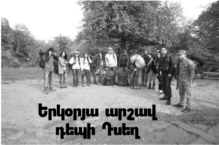
Երկօրյա արշավ դեպի Դսեղ