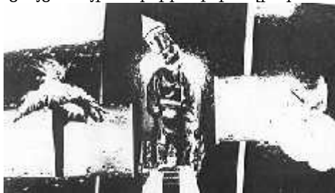
շատ թանկ էր: 22

Միննուն կոլաժը մեկնաբանվում է նաև այնպես, որ մարդիկ խավիար ուտելուց հետո պահում էին տուփը, որպեսզի հետո հարևաններին և բարեկամներին ցույց տային, որ իրենք խավիար են կերել, որովհետև այն