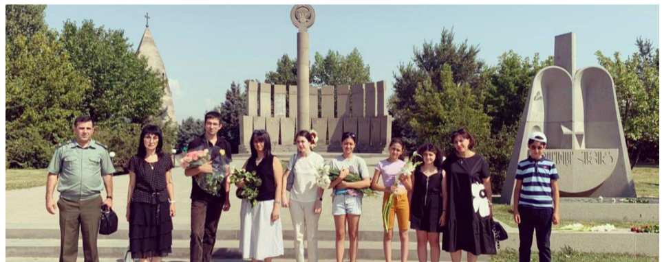
Ուխտագնացության վերջում աշակերտները նշեցին, որ այժմ էլ ավելի լավ են պատկերացնում հայոց պատմության էջերը, որոնց մասին բազմիցս խոսվել է դպրոցում «Հայրենագիտության» դասերի ընթացքում:

Դպրոցի սաներն այցելեցին նաև 1967 թվականին հիմնադրված «Ծիծեռնակաբերդ» պատմահամագիտական համալիր, որտեղ ծաղիկները դնելով իրենց խոնարհումի տուրքը մատուցեցին Հայոց ցեղասպանության զոհերի հիշատակին, ովքեր նահատակվեցին հանուն հավատի և հայրենիքի: