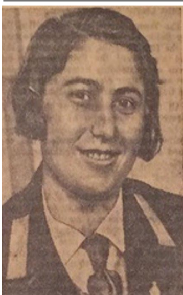
«Երկնային հեռուներում իմ հոգին խաղաղ կմնա, եթե երկրի վրա իմ ոտնահետքերը մամուռներով չպատվեն»: