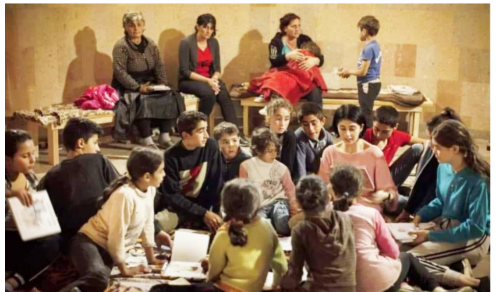
Արցախցի երեխաները ապաստարանում անգամ սովորում են:

Գրանցման վկայական՝ 01Մ00184 տրված է 26.03.2008 թ. Հասցեն՝ Տիգրան Մեծի 17, հեռ. 59-70-97: Էլ. փոստ՝ Newspaperaspu.am, asryansilva@gmail.com Տպագրված է «Տիգրան Մեծ» հրատարակչության տպագրատանը: Հասցեն՝ Արշակունյաց 2 Տպաքանակը՝ 1800 օրինակ: Ծավալը՝ 2 տպ. մամուլ