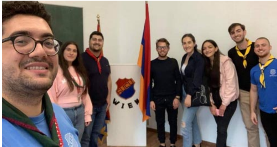
մագործակցության բաժնի ջերմ վերաբերմունքով:

Ընդգծելով ծրագրի ընձեռած մասնագիտական հնարավորությունները՝ ուսանողուհին նշում է, որ Վիեննայում եղած ժամանակահատվածում ավելի քան արժևորեց Մանկավարժական համալսարանը, երկու համալսարանների միջև հաստատված կայուն, խոր և արդյունավետ համագործակցությունը պայմանավորված է նաև միջազգային հա-