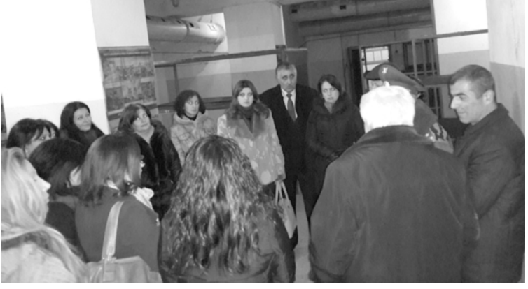
Մանկավարժական համալսարանի և UNICEF-ի հետ համատեղ անցկացվող «Աղետների ռիսկերի նվազեցման ամրապնդումը ՀՀ-ում ուսումնական պլանում» ծրագրի շրջանակներում առաջին բուժօգ-

Օ Հոկտեմբերի 1-ին և 2-ին մեկնարկեց ՀՀ-ի հատուկ կրթության ֆակուլտետի նախաձեռնությամբ, ՀՀ-ի, Գիտության պետական կոմիտեի, Յունիսեֆ Հայաստան կազմակերպության, Հայաստանում ԱՄՆ դեսպանատան, Տեմպուսի ASPIRE ծրագրի ֆինանսական աջակցությամբ անցկացվող «Ներառական կրթություն. Ժամանակակից հիմնախնդիրներն ու մարտահրավերները» խորագրով միջազգային երկօրյա գիտագործնական գիտաժողովը: Գիտաժողովին մասնակցեց 100-ից ավելի մասնագետ Հայաստանից, Ռուսաստանից, Բելառուսից, Ղազախստանից, Ուկրաինայից, Ուկրաինայից, Ֆինլանդիայից, Շվեյցարիայից, Շոտլանդիայից, Չեխիայից, ԱՄՆ-ից. այդ թվում բուհերի պրոֆեսորներ, ներառական հաստատությունների տնօրեններ, բազմամասնագիտական թիմերի անդամներ, ուսուցիչներ, հասարակական կազմակերպությունների, ծառայություններ մատուցող կենտրոնների, կլինիկաների ղեկավարներ ու ներկայացուցիչներ: Գիտաժողովին քննարկվեցին կրթության առաձեռնահատուկ պայմանների կարիք ունեցող անձանց որակյալ կրթության, սոցիալիզացիայի հիմնահարցերը, մարտահրավերները, նախանշվեցին անելիքները՝ հայրենական և միջազգային առաջավոր փորձի հիման վրա: