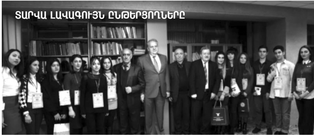
ՏԱՐՎԱ ԼԱՎԱԳՈՒՅՆ ԸՆԹԵՐԳՈՂՆԵՐ