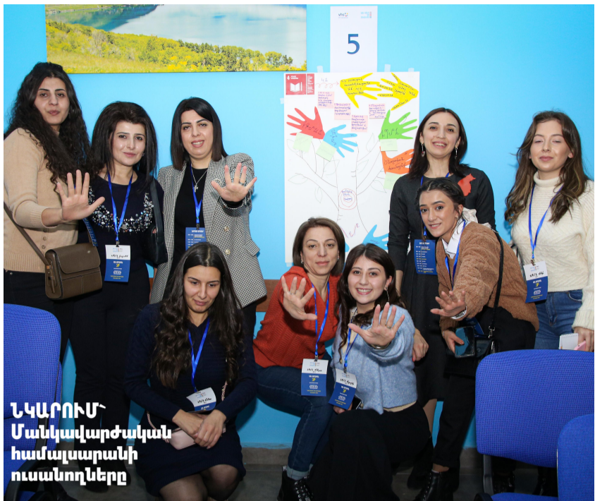
ՆԿԱՐՈՒՄ՝ Մանկավարժական համալսարանի ուսանողները

«Դի-Վի-Վի ինթերնեյշնլի» հայաստանյան գրասենյակը ՀՀ ԿԳՄՍ նախարարության հետ համագործակցությամբ իրականացնում է «Մեծահասակների կրթությունը՝ ի նպաստ կայուն զարգացման նպատակների» արշավը, որի շրջանակում նույնների 27-ին Սևան քաղաքում տեղի է ունեցել «Կայուն զարգացման նպատակներ. կանգառ Սևանում» երիտասարդական ֆորումը: Ֆորումին մասնակցում էին 8 երիտասարդական խմբեր ՀՀ տարբեր մարզերի քաղաքներից և կառույցներից, որոնք մեկ օրվա ընթացքում տարբեր դիտանկյուններից ուսումնասիրեցին ՄԱԿ-ի կայուն զարգացման նպատակները և մշակեցին ծրագրեր՝ ուղղված դրանց իրագործմանը: