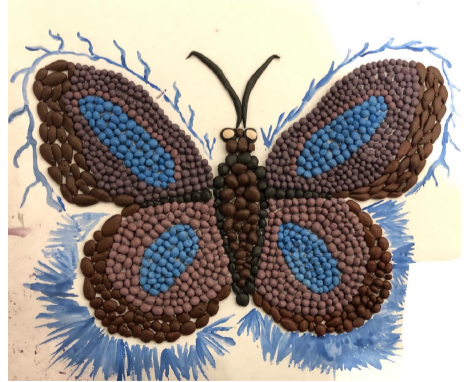
Մերի մկրտչյան Սկզբնական կրթության ֆակուլտետ Տարրական մանկավարժություն և մեթոդիկա 3րդ կուրս