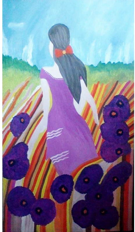
Նարինե Բաղդասարյան Սկզբնական կրթության շրջանավարտ

ջով, կյանքի տարբեր կողմերի սոցիալական բազում դժվարությունները, անձի հուզական վիճակի հաղթահարման, կարգավորման միտումը արվեստի միջոցով եզակի հնարավորություն է ուսանողների համար, ինչը նաև իրականացվում է ուսումնական «Կերպարվեստի դասավանդման մեթոդիկա» առարկայի գործնական դասաժամերին: Ֆակուլտետի ուսանողներն ակտիվորեն ընդգրկվում են ստեղծագործական գործունեության մեջ՝ իրենց երազանքները, մտորումները, հույզերը, զգացմունքներն ու մտքի թռիչքները կերպարվեստին հատուկ լեզվով ներկայացնելու և փոխանցելու դիտորդին: «Աշխարհի գույներ» առցանց ցուցահանդեսի աշխատանքներն ուղեկցվում էին հայ բանաստեղծների և աշխարհահռչակ հայ երգահանների ստեղծագործություններով: Ապագա մանկավարժների համար երեխաների հետ աշխատելու հիանալի միջոց է կերպարվեստը՝ իր տեսակներով լավագույն հնարավորություն՝ բացահայտելու երեխայի յուրօրինակ անհատականությունը և ներաշխարհը, արտահայտելու սեփական տեսակետը, երեխայի «Ես»-ի արտահայտման ու դրսևորման յուրահատուկ ձև: Հենց դրան էլ միտված են նման ցուցահանդեսները, որոնք ոչ միայն գեղագիտական հաճույք են պատճառում դիտորդին, այլև զարգացնում ու կրթում են ուսանողների ստեղծագործական միտքը: