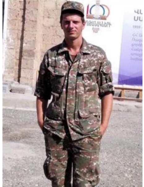
հոգին ծախսող հուղաներ չեն լինի: Ահա սա է հերոսացման ճանապարհը, որի համար այսքան թանկ վճարեցինք:

ցանք, ճանաչեցինք իրար, լավ ճանաչեցինք: Կամանդիրի օգնությամբ մի կերպ դուրս եկանք: 6 օր մնացինք այդտեղ: Առաջին երկու օրը ոչ հաց կար, ոչ էլ ջուր: Քնում էինք խոնավ փոսերում: Խրամատներ էինք փորում ձեռքով ու սվին դանակով: Պատկերացնում եք, քայլեցինք 70 կմ, որպեսզի հասնենք Գորիսի զորամաս: Վիճակ չկար, բայց քայլում էինք: Փախչում էինք մահից, գնում էինք դեպի փրկություն: Դետո իմացանք, որ կռվել ենք հատուկ ջոկատայինների դեմ, որոնք 7-8 տարի պատրաստված զինվորներ էին: 1500 հոգի էին, որոնցից 300-ին սպանել էինք: Դիշեցի՝ մարդ են սպանել, բայց