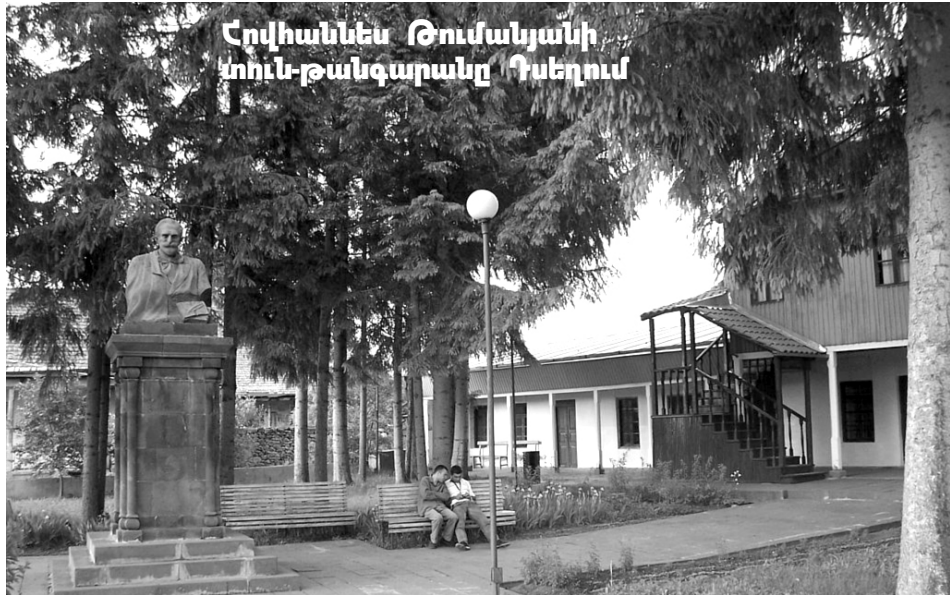
Հովհաննես Թումանյանի տուն-թանգարանը Դսեղում